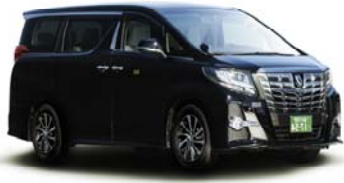
ホテルまでハイヤーがお迎えにあがります。