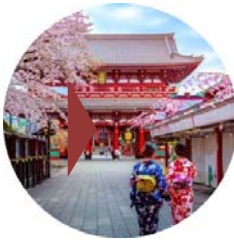
東京観光をお楽しみください。