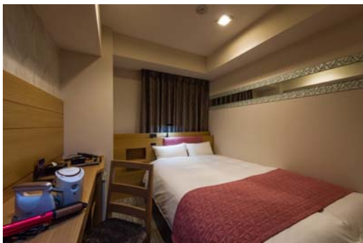
“レディース”コンセプトルーム